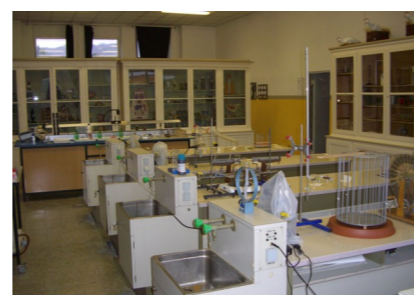
Il laboratorio scientifico

Istituto di Istruzione Superiore "Leonardo Da Vinci"